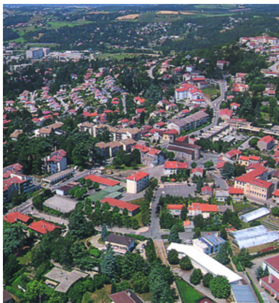
Saint-Priest en Jarez