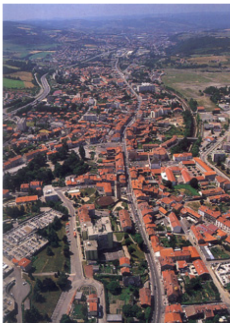
La Ricamarie

Le secteur de l'ouest stéphanois est structuré d'une part par la vallée de l'Ondaine, à l'urbanisation traditionnelle dense, et connaissant les problèmes de déprise des anciennes vallées industrielles, et d'autre part des plateaux de l'ouest stéphanois sur lesquels se développent l'habitat résidentiel.