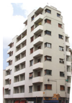
Immeuble de Bossu, "années 30", rue Michelet, St-Etienne

- Les immeubles des années 30 à 60, qui se sont intégrés à la trame de l'îlot. Cette typologie est présente dans tous les centres ville et à St Etienne de façon plus importante pour les constructions des années 30. Ces immeubles sont principalement des copropriétés.