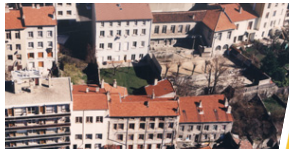
Maisons collinaires, St-Etienne

- Des cités ouvrières : maisons individuelles ou jumelées.