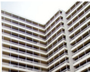
Centre 2, St-Etienne

Dans les centres anciens des vallées constitués sur des trames urbaines étroites et aux constructions très denses (St Etienne, St Chamond, Firminy, Roche la Molière, La Grand Croix, Rive-de-Gier...), on identifie