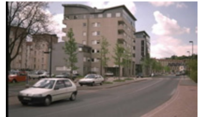
Traversée de Saint-Chamond

- Des cités ouvrières : maisons individuelles ou jumelées.